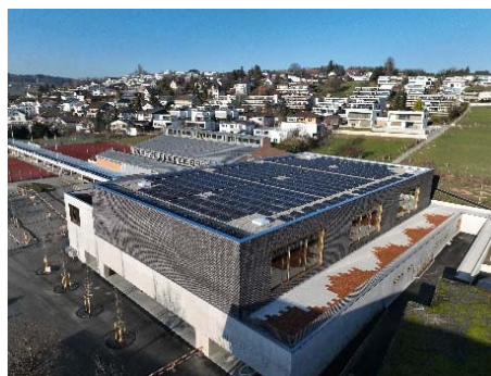
Sporthalle Hofmatten Photovoltaik-Anlage

Weitere Auskünfte für Medienschaffende erteilt: